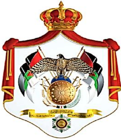
الشكل (١-١٢): شعار المملكة الأردنية الهاشمية.