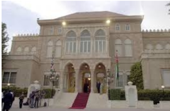
قصر رغدان العامر

عمّان : عاصمة المملكة الأردنية الهاشمية ، وهي مقرّ جلاله الملك ، وفيها المباني والوزارات المهمة . ومن أهم المعالم المعاصرة لمدينة عمّان الحديثة :