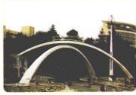
مدينة الحسين الطيبة