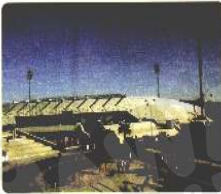
مدينة الحسين للشباب