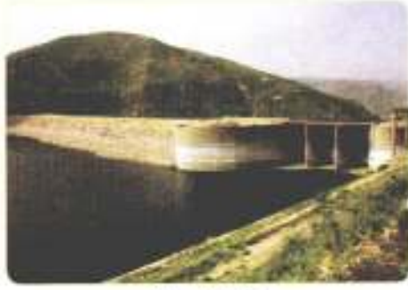
سدّ الملك طلال

منجزات حضارية في عهد الملك الحسين بن طلال :