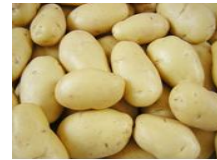
(أ) تؤكل مطبوخة