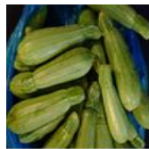
(هـ) تؤكل مطبوخة