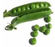
(ب) تؤكل مطبوخة